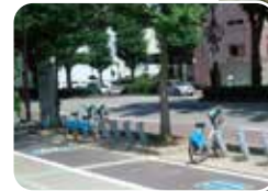
まちなか自転車レンタル