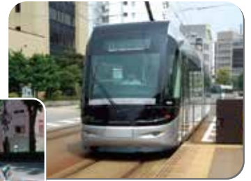
LRT(富山ライトレール)

合併により面積が大きくなった中で人口減少を迎えた中核市の「まちづくり政策」について、先進的に取り組んでいる富山市での公共交通政策を中心にした取り組み状況を勉強してきました。ポイントは「いかにコンパクトにしていくか」ということで、コンパクトをキーワードに中心市街地から公共交通を軸とした拠点集中型のまちづくりを実施中とのことでした。特徴としては、駅500mバス停300m範囲を圏域として設定していること。多少なりとも「歩く文化」を根付かせないと公共交通政策は成功しないという認識からですが、車社会である本市におきましても同様のことが言えるかと思えます。