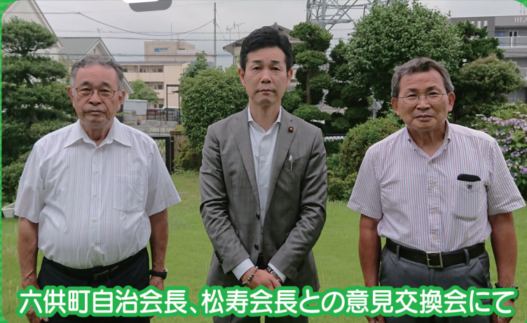
六供町自治会長、松寿会長との意見交換会にて