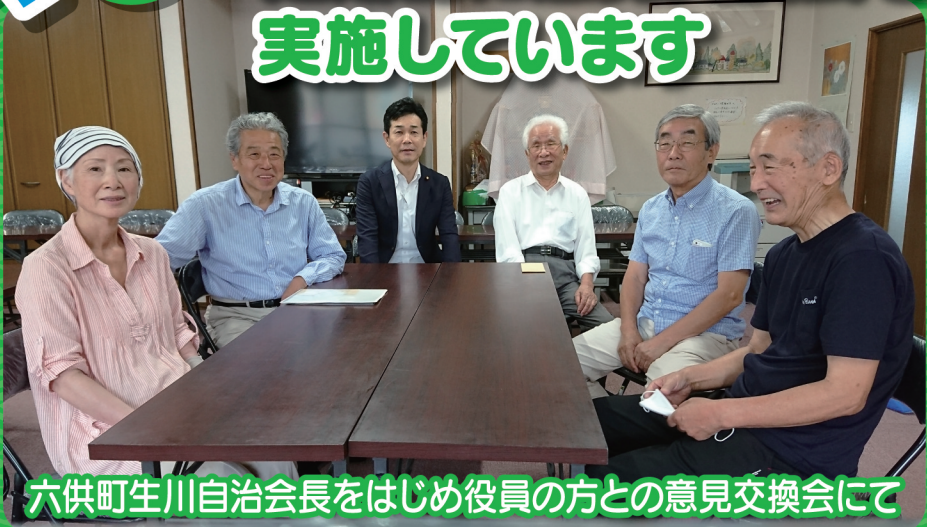
六供町生川自治会長をはじめ役員の方との意見交換会にて